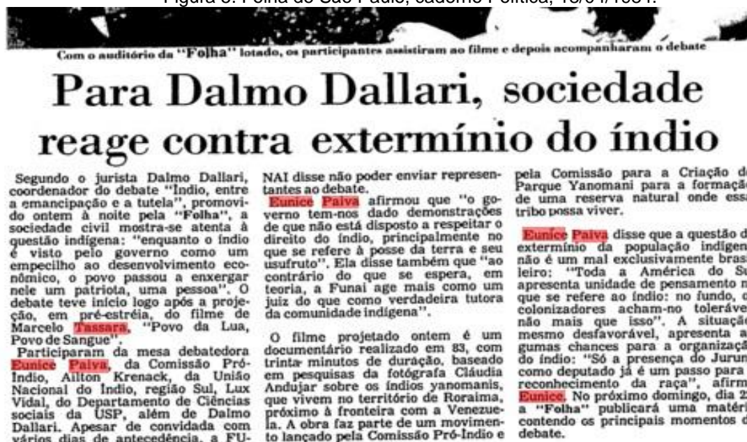
Figura 5. Folha de São Paulo, caderno Política, 18/04/1984. 6