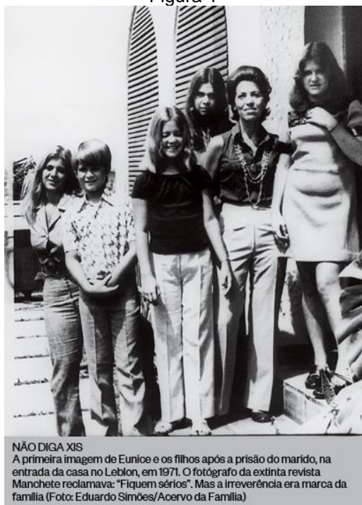
Figura 1 2