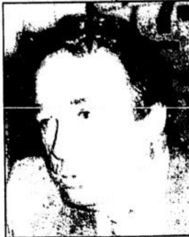
Lyra comanda reativação do Conselho

No entanto, a "Nova República", apesar de prometer redemocratizar o País, não pretende revolver o passado.