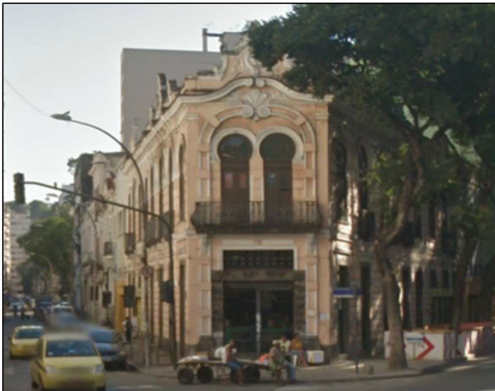
Sobrado da SAARA

A área atualmente denominada como SAARA configura-se com um espaço histórico do desenvolvimento urbano na cidade e que ainda preserva sobrados neoclássicos típicos da época de construção, contando um pouco da história de ocupação da região. Atualmente funciona como um shopping a céu aberto. Os sobrados estão edificadas em lotes muito estreitos e compridos e apresentam uma volumetria homogênea que conforme legislação necessita ser preservada.