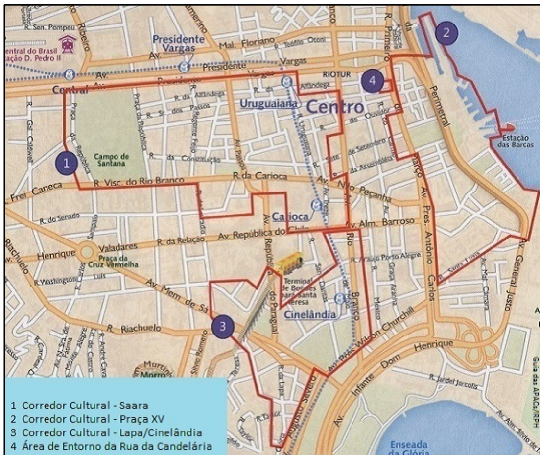
Mapa do Corredor Cultural.

A subdivisão do Corredor Cultural pode ser observada no mapa a seguir, que consta no material fornecido pela municipalidade sobre a área em análise. Nesse mapa podem-se observar as subdivisões existentes na área central.