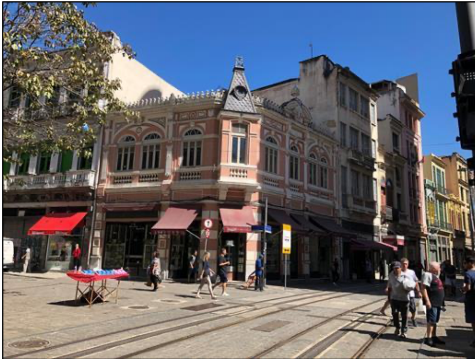
Casa Cavé, fundada em 1860 – Rua Sete de Setembro esquina com Rua Uruguaiana

o relógio da Carioca, a Confeitaria Colombo, a Casa Daniel (com seu interior Art Decó) e a Casa Cavé.