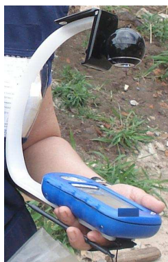
Figura 1. Artefato acoplado ao PDA com webcam .

(b) Gravações em vídeo da interação do entrevistador com o PDA na hora da entrevista: muitas vezes os entrevistadores enfrentavam problemas de interação ao manipular o PDA na hora em que iam entrevistar os informantes. Os pesquisadores não tinham a visão da tela do equipamento, somente o entrevistador conseguia ver a tela, pois o PDA estava em suas mãos e direcionado para ele. Então, os pesquisadores decidiram filmar as entrevistas, com o cuidado de considerar as limitações de uso das gravações, pois alguns informantes podem não se sentir à vontade ao serem filmados ou fotografados [Childs & Landreth 2006]. Para evitar tais constrangimentos, os pesquisadores optaram por gravar somente a tela do PDA, mantendo a privacidade da entrevistadora e do informante. Para isso, foi construído um artefato projetado com uma extremidade para encaixar no case protetor do PDA e portar uma webcam sem fio em sua outra extremidade (Figura 1).