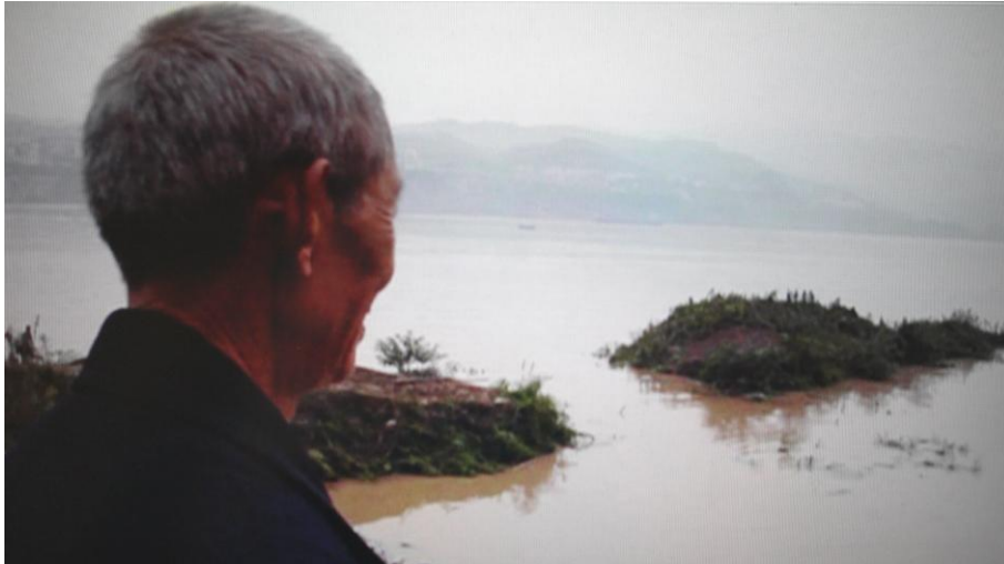
Camponês a olhar para a subida das águas em Hubei, Três Gargantas, China. Yung Chuan, Up the Yangtze , DVD, 2007.

Estes exemplos mostram claramente como a inundação da paisagem é um evento que as pessoas se obrigam a ignorar ou deixam de observar enquanto espectadores. Os sentimentos de descrença, orgulho, tristeza ou agonia indicam um fluxo de energia e uma série de negociações entre o que é percebido e aquele que percebe, reveladores de um evento performativo a que me refiro como performance de paisagem.