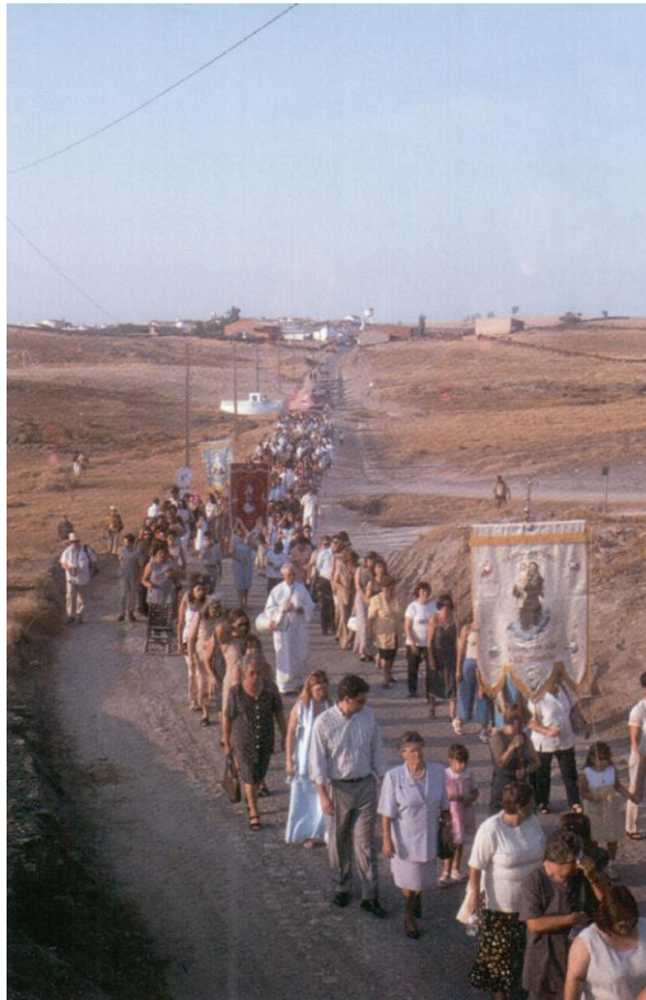
Procissão entre a antiga e a nova Aldeia da Luz. Foto: Clara Saraiva (Saraiva, 2005).

deslocamento de cemitérios nas aldeias afetadas, que envolve o difícil processo de exumação e reenterro dos corpos. A antropóloga portuguesa Clara Saraiva dá conta da missa cerimonial organizada na aldeia da Luz pela igreja com a presença do bispo distrital em memória dos mortos da aldeia. A cerimónia, que decorreu na Igreja da Nossa Senhora da Luz, situada na aldeia antiga, transformou-se numa procissão até à nova aldeia, a 2 km. A nova missa foi então celebrada numa réplica da antiga Igreja da Nossa Senhora da Luz, construída já na nova aldeia. O carácter oficial da cerimónia em honra dos mortos e envolvendo uma procissão entre as aldeias foi um rito de passagem importante para os habitantes da Aldeia da Luz.