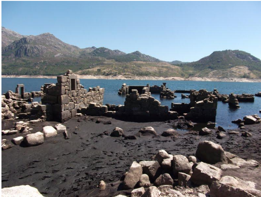
Vilarinho da Furna na estação seca.

de Vilarinho da Furna em Portugal, e Mediano em Espanha, as aldeias inundadas mas não destruídas reaparecem na estação seca.