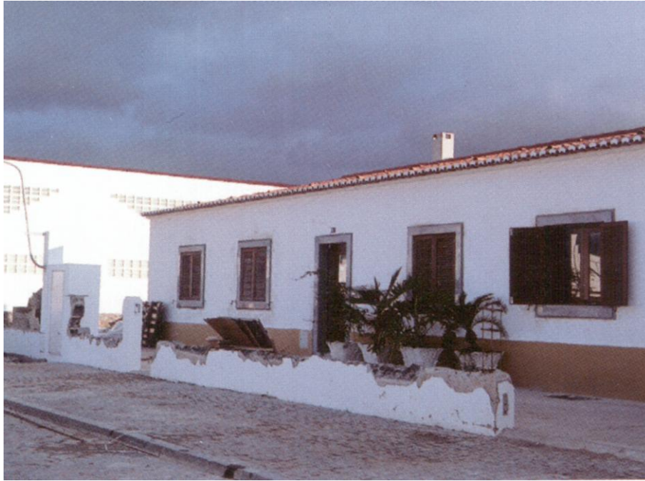
Casas novas a ser modificadas na nova aldeia da Luz. (Saraiva, 2005).