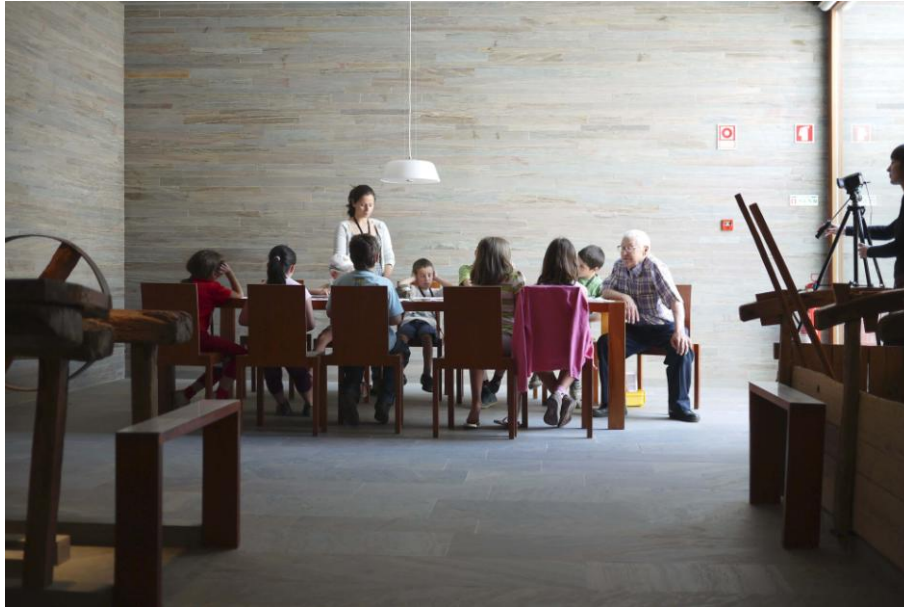
Conversa à mesa da memória, Museu da Luz, abril de 2011.

A memória também pode ser fixada em lugares e paisagens. Revelando marcos reconhecíveis de uma terra submersa e desaparecida, as secas sazonais ou as operações de drenagem de manutenção das barragens provocam situações peculiares que envolvem a performance da paisagem, mas também a performance da memória. Armelle Faure defende que por vezes as barragens se tornam “lugares de memória”, na medida em que provocam “viagens de peregrinação” dos habitantes deslocados (Faure, citando Pierre Nora, 2000: p. 104). Neste caso, a performance da memória estabelece uma comunicação sensorial entre o indivíduo e a terra. Durante os esvaziamentos, os elementos naturais evoluem numa cenografia cinética que parece dar vida à paisagem. As transformações da paisagem solicitam a consciência do indivíduo como espectador de teatro. A água desaparecida revela uma terra transformada. O reaparecimento de uma aldeia submersa intacta não restitui a antiga aldeia; revela a versão traumatizada e ferida da aldeia desaparecida, e o espectador que por acaso também é o antigo habitante deve solicitar a sua criatividade e imaginação para restaurar o que escapa ao olhar. Nesse sentido, é possível falar em performance da memória. Quando José Reymond assiste à operação de drenagem da barragem de Tignes, que revela a sua aldeia desaparecida, descreve perfeitamente a sua imaginação a funcionar: