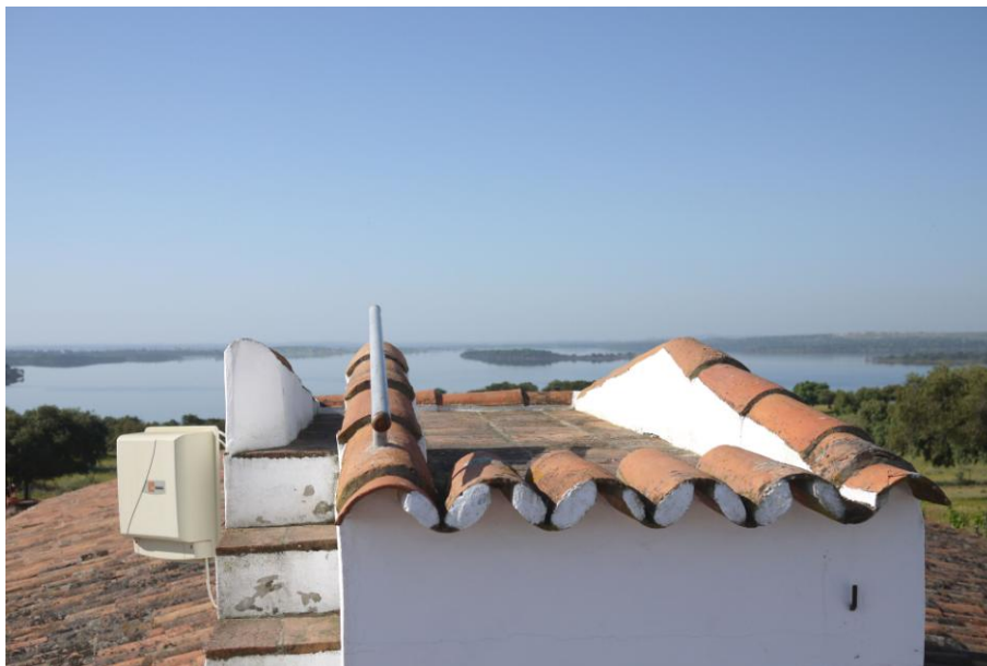
Terraço no telhado do Monte do Caneiro, abril de 2011.

O Museu da Luz, situado à beira do reservatório do Alqueva, está agora a mapear caminhos pedonais ao longo das margens. Propondo novas trajetórias num território que ainda não é praticado, o Museu da Luz convida simbolicamente o aldeão ou o visitante a restaurar uma nova cultura rotineira.