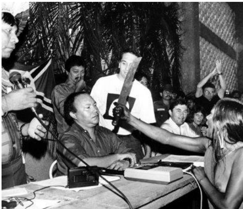
Jovem Kayapó ameaça o presidente da Eletronorte, Altamira, 1989. Disponível em: http://www.internationalrivers.org/latin-america/amazon-basin/tuira-kayap-altamira-gathering1989 Acesso em: dez/2011.

A floresta amazônica enfrenta agora nova ameaça, pois o governo de Dilma Roussef aprovou e iniciou a construção da barragem de Belo Monte. A ONG Amazon Watch tem estado ativa na defesa do rio Xingu e atraiu as atenções dos media organizando eventos e encontros com a presença de celebridades como James Cameron. O Movimento Gota d'Água juntou os atores mais conhecidos da Rede Globo para fazer um spot contra a construção da barragem de Belo Monte. Publicado no Youtube em finais de novembro de 2011, o spot foi visto 1.245.277 vezes em quatro semanas. Seja exibindo imagens de resistência fortes seja expondo celebridades da indústria das artes performativas, os media servem de palco para as performances de protesto contra a construção de barragens.