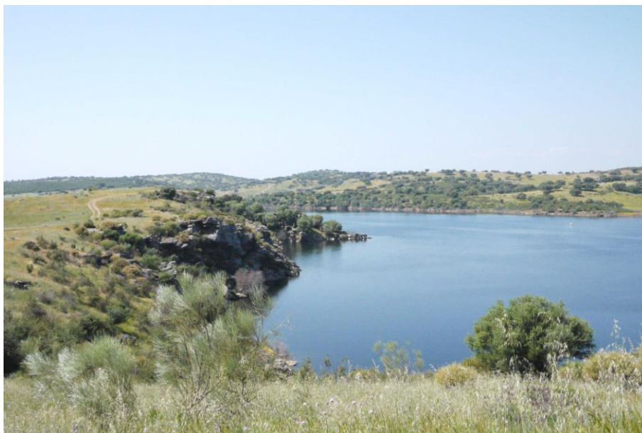
Caminho pedonal ao longo do reservatório do Alqueva, abril de 2011.

O Museu da Luz, situado à beira do reservatório do Alqueva, está agora a mapear caminhos pedonais ao longo das margens. Propondo novas trajetórias num território que ainda não é praticado, o Museu da Luz convida simbolicamente o aldeão ou o visitante a restaurar uma nova cultura rotineira.