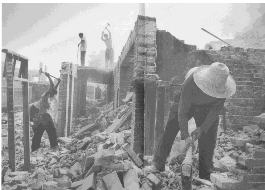
Habitantes de Badong, em Hubei, China, destroem as suas casas para recuperar e reciclar tijolos. (Montavon; Koller, 2006: p. 66).

A mudança de casa também pode ser vista como rito de passagem; e é assim que considero os atos de embalar, transportar, limpar e desembalar, tendo em conta que pressupõem a participação ativa do corpo numa transição espaço-temporal. Nalguns casos, as mudanças assumem proporções consideráveis. Durante a construção da barragem das Três Gargantas, na China, os camponeses destruíram as suas próprias casas para reciclar os tijolos para construírem uma nova casa noutro sítio.