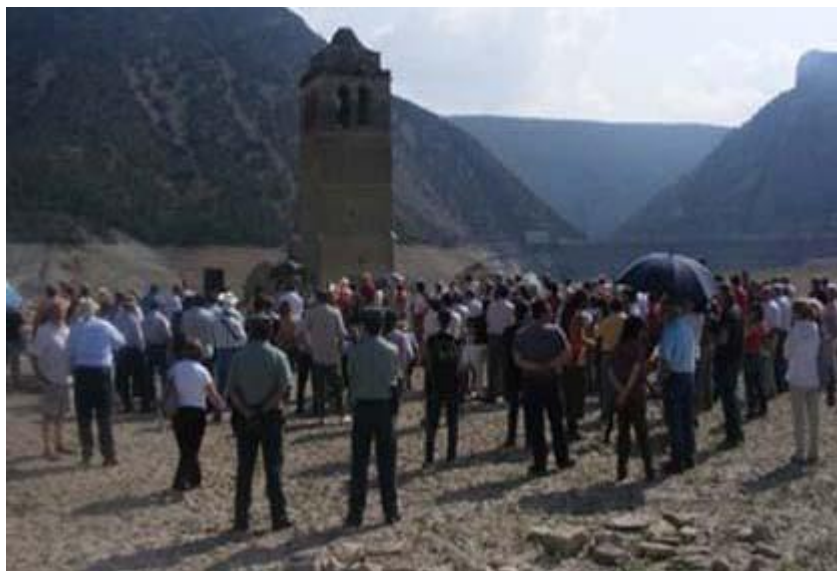
Os habitantes de Mediano juntam-se para ouvir o sino tocar. Disponível em: http://campaners.com/php/textos.php?text=3553 Acesso em: dez/2011.

Em Espanha, a comunidade deslocada de Mediano organizou um interessante evento que também combina performance da paisagem e performance da memória. Todos os anos, no final do verão, o reservatório esvazia-se e revela a igreja da aldeia desaparecida. Em 26 de setembro de 2009, os habitantes de Mediano decidiram instalar um sino na torre da igreja vazia. A instalação do sino tornou-se performance da memória quando a população de Mediano se juntou na terra lamacenta para voltar a ouvir o sino ressoar pela paisagem.