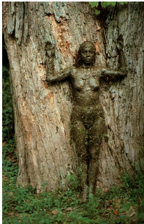
Siluetas Series - "Arbol de la Vida" - Ana Mendieta 1976

Em antigas sociedades matrilineares tanto do neolítico, como de eras mais recentes a este período, a terra era a vida, a alimentação brotava do solo, assim como tudo o mais, que em sua diversidade sustentava a existência – sendo considerada uma das faces da própria mãe criadora de todas as coisas. O corpo da mulher representava a mesma capacidade mágica de gerar vida, era a terra de onde brotava um novo ser humano e que por alguns meses ainda iria oferecer o leite essencial para o seu desenvolvimento.