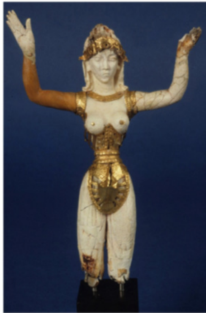
Deusa Minóica – Creta - 1600-1500 a.C.