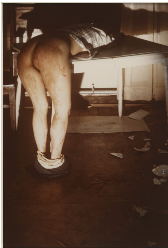
Untitled - Rape Scene – 1973

Por cerca de quinze anos, Ana Mendieta realizou uma obra profícua em proposições, sua práxis artística incluiu escultura, pintura, vídeo e fotografia. Seu corpo, assim como a natureza, foram instrumentos cruciais de seus processos artísticos: imiscuí-a-se em lama, sangue, água, pedras, penas, entre outros elementos. As performances que compôs possuíam forte teor ritualístico, com referências a cerimônias ancestrais.