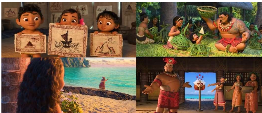
Figura 1 - Capturas de tela do cenas da animação localizadas entre 00:07:46 e 00:12:00

As cenas correspondentes a esse momento apresentam os movimentos feitos pelos pais da protagonista em mostrar, à Moana, que seu lugar é na ilha, liderando o seu povo. Moana é vista como o futuro da Ilha de Motonui.