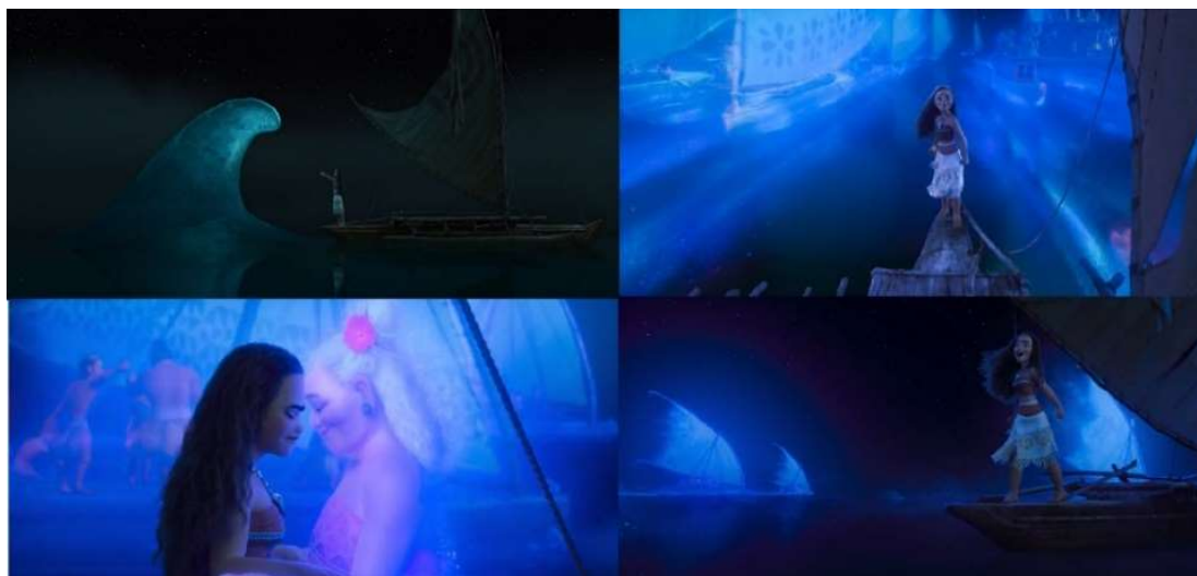
Figura 3 - Capturas de tela das cenas da animação localizadas entre 01:18:04 a 01:23:35

A música obtém referências ao legado que a protagonista porta, bem como às suas premissas identificatórias quando essa encerra a música cantando “Eu sou Moana!”.