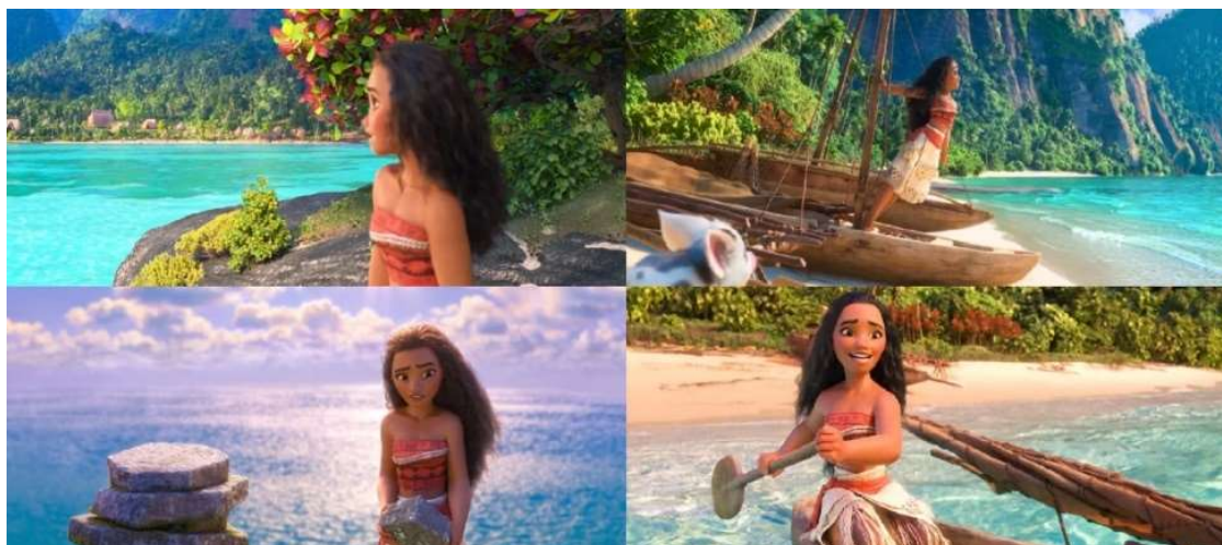
Figura 2 - Capturas de tela das cenas da animação localizadas entre 00:16:15 e 00:18:42

e onde se tem tudo, a segunda, entretanto, apresenta os sentimentos de não adequação de Moana.