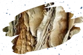
Imagem 6 – Galeria EFLCH e montagem Onde estão os peixes no Aquário?