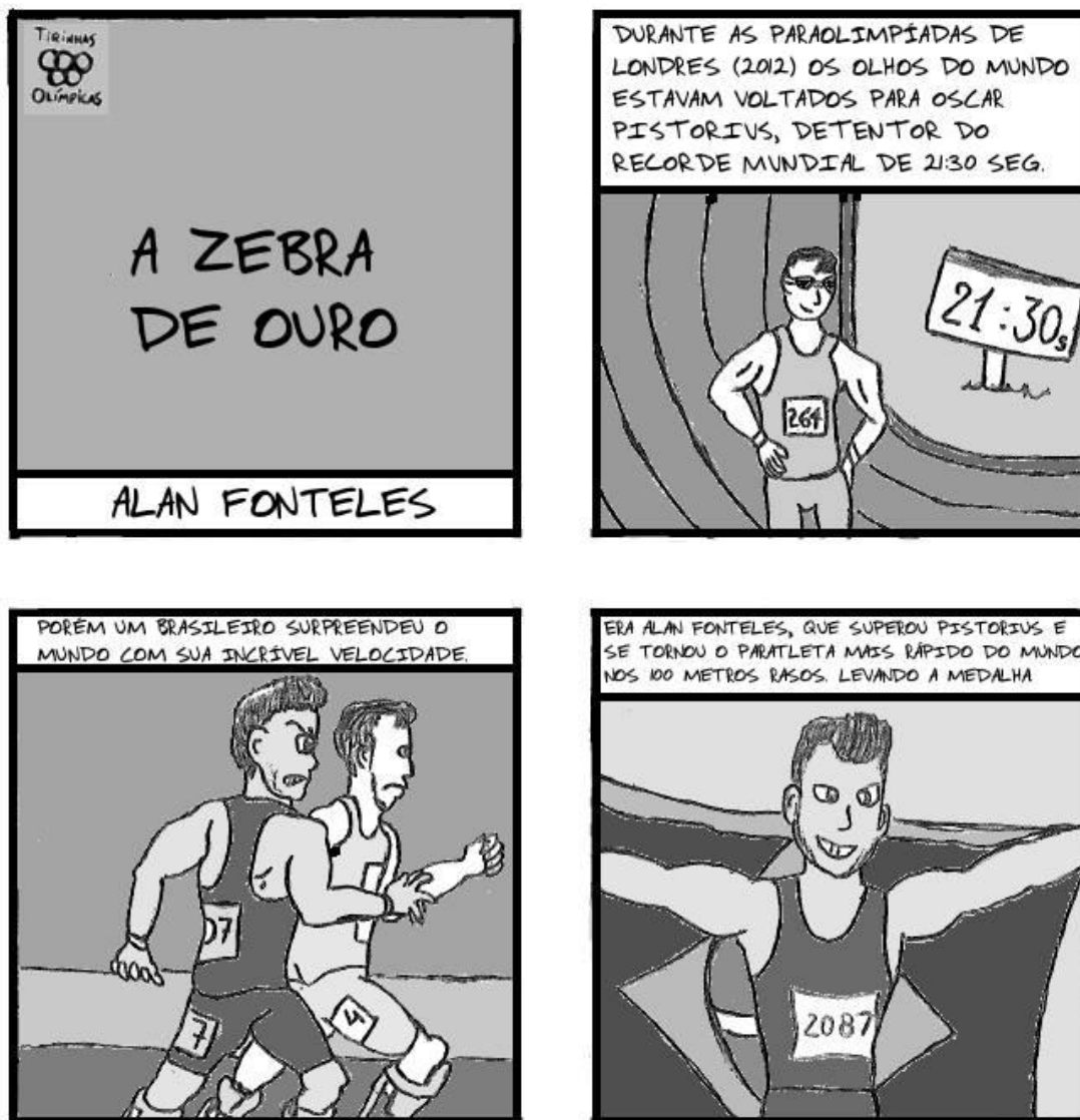
Figura 2 – Exemplo de tirinha desenhada pelo discente bolsista

Imagem disponível em: https://www.facebook.com/tirinhasolimpicas/photos/pb.1014951998570864.-2207520000.1462300050./1046879012044829/?type=3&theater . Autoria: Vinícius Passos Soares