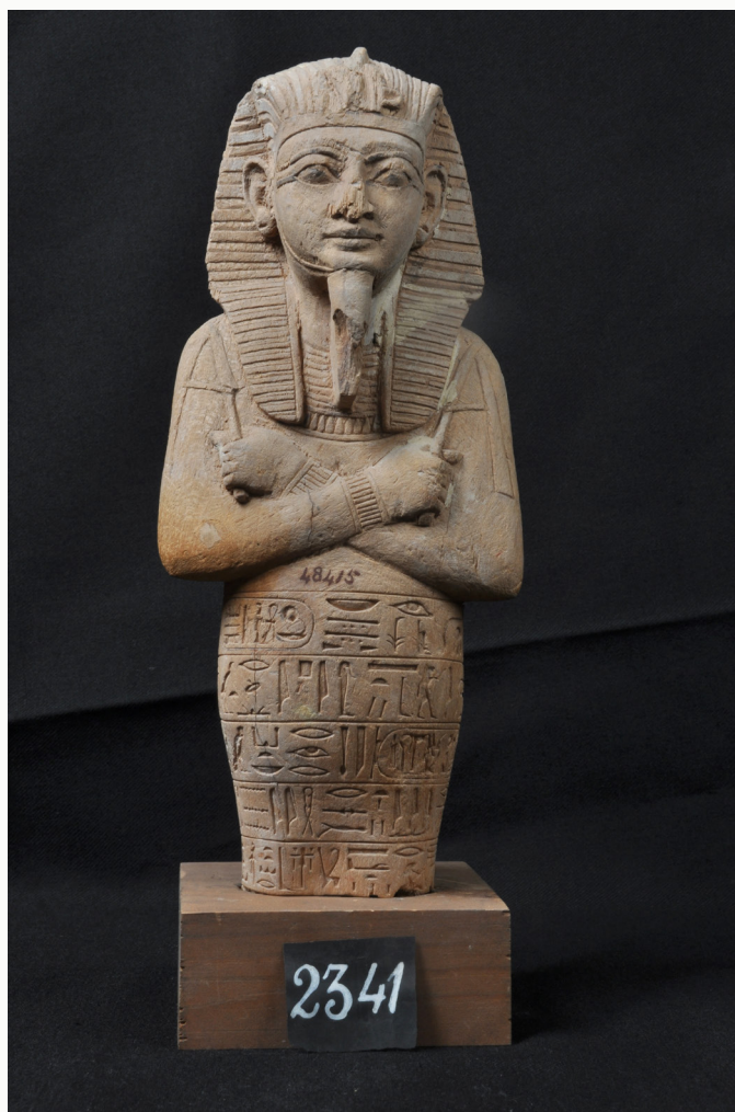
Photo 1 – Chaouabti de Ramsès VI Amonherkepshef II Nebmaâtrê Meryamon CAIRE CG 48415 JE 96857 SR 4/2341/0

D e manière générale on peut observer que les chaouabtis (photo 1) ont eu une diversité d'interprétations fonctionnelles dans leur histoire de deux mille ans d'utilisation et leur vision par les Égyptiens n'est pas restée immuable. Dans un premier temps, ces statuettes se sont manifestées comme un moyen de remplacer les morts physiquement, c'est-à-dire, de dépositaires du Ka, servant pour la manutention de la mémoire, ainsi que de remplaçants pour les travaux agricoles et le maintien de la nourriture des morts dans l'au-delà; car ces figurines qui semblent être apparues avec la disparition des modèles de l'Ancien Empire, travaillent non seulement pour les morts, mais aussi à la place des morts, en étant des doubles du défunt qui labourent, et également des images magiques du propriétaire en soi qui seraient une garantie en cas de destruction du corps.