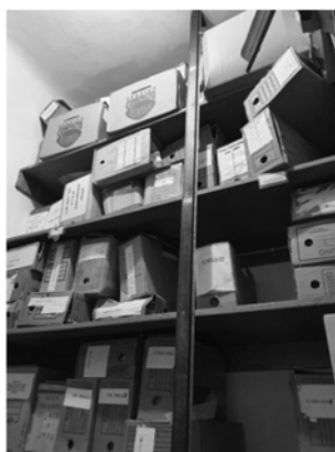
Fig. 1: Caixas no SindMusi onde estão acondicionados parte do acervo tratado nessa pesquisa. Registro realizado pelo autor.

Com o meu ingresso como doutorando no PPGM da UNIRIO, pude cursar no segundo semestre de 2019 a disciplina Tópicos Especiais, cuja finalidade era a apreensão de conteúdos relacionados a manipulação e organização do acervo documental do SindMusi. O grupo discente 9 , em conjunto com a docente, iniciou um trabalho de identificação dos tipos de documentos encontrados nas caixas empilhadas na sala principal do acervo. Foram identificados variados tipos de documentos: atas, fichas de matrícula dos músicos pertencentes ao Centro Musical do Rio de Janeiro (CMRJ) e ao SindMusi, propostas de admissão do CMRJ e do SindMusi, notas contratuais da Rede Globo de Televisão, contratos coletivos de trabalho, fichas de músicos que pertenceram a Rádio Mayrink Veiga, documentos pessoais dos músicos que pertenceram ao SindMusi (carteira de trabalho, identificação civil, entre outros), fonogramas diversos, periódicos, cartas trocadas entre instituições e documentos de outras instituições (grande parte da Orquestra Sinfônica Brasileira).