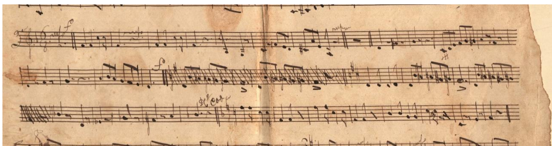
Fig. 2: Fotografia de rasura sem data. Quadrilha Os rufos. Acervo da Banda da Polícia de Diamantina.